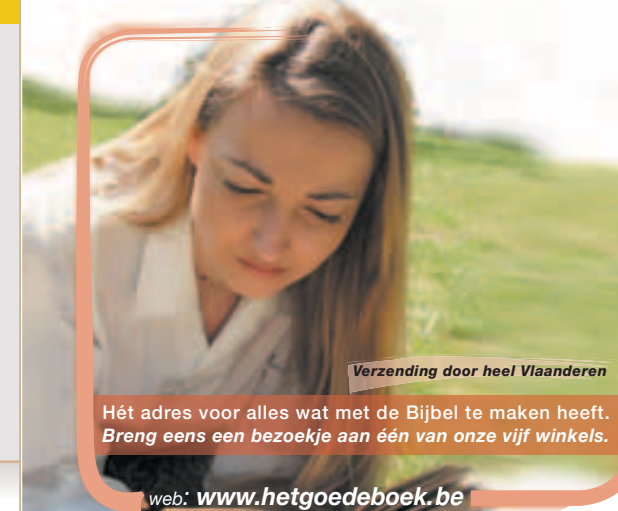
Verzending door heel Vlaanderen